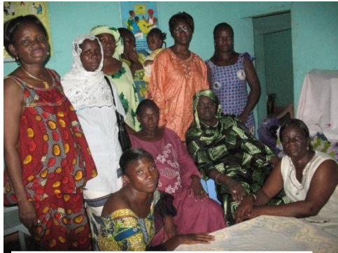
Community home visitors

The project focused on increasing the knowledge of contraceptive options, including EC, of women living with HIV, and on improving access to these methods. Domestic visits to women both living with HIV and uninfected women, alongside a sensitization strategy, helped to increase awareness of EC as well as provide women with the skills to negotiate dual protection with their sexual partners. Nearly 5,500 persons were directly exposed to EC information in thrice-weekly meetings conducted by the health teams.