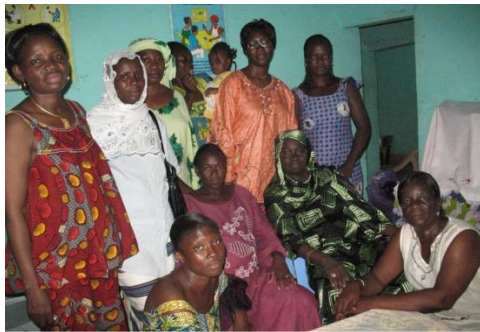
Visiteurs communautaires dans les foyers équipes sanitaires.

Le projet s'est concentré sur l'augmentation des connaissances des options contraceptives, y compris la CU, des femmes vivant avec le VIH et sur l'amélioration de l'accès à ces méthodes. Les visites dans les foyers des femmes vivant avec le VIH et des femmes non infectées, parallèlement à une stratégie de sensibilisation, a aidé à augmenter la connaissance de la CU et a doté les femmes des compétences nécessaires pour négocier une protection mutuelle avec leurs partenaires sexuels. Environ 5500 personnes ont reçu des informations sur la CU lors de réunions menées trois fois par semaine par les